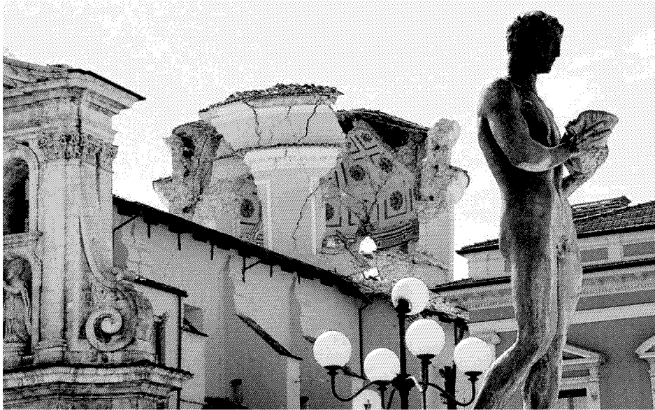
L'Aquila terremotata. In alto, Mario Monti e Giorgio Napolitano