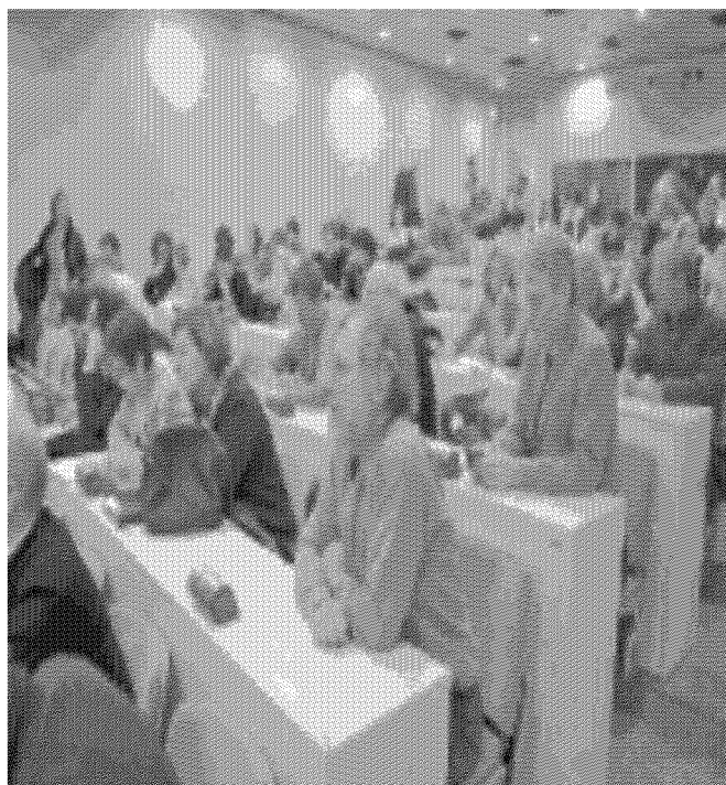
All'assemblea di ateneo tra Trento, Rovereto e Povo erano presenti circa 200 persone